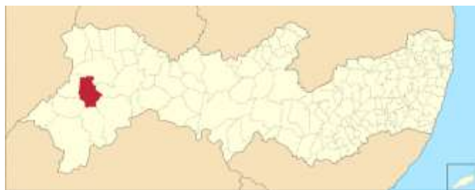
Figura 1 - Localização de Santa Cruz em Pernambuco.

O município localiza-se a uma latitude 08°14'24" sul e a uma longitude 40°20'05" oeste, estando a uma altitude de 515 metros. Faz limite com os municípios de Ouricuri (norte), Lagoa Grande (Pernambuco) (sul), Parnamirim (Pernambuco) e Santa Maria da Boa Vista (leste) e Dormentes e Santa Filomena-PE (oeste).