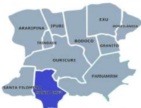
Figura 2 – Mapa do Sertão do Araripe.

O município localiza-se a uma latitude 08°14'24" sul e a uma longitude 40°20'05" oeste, estando a uma altitude de 515 metros. Faz limite com os municípios de Ouricuri (norte), Lagoa Grande (Pernambuco) (sul), Parnamirim (Pernambuco) e Santa Maria da Boa Vista (leste) e Dormentes e Santa Filomena-PE (oeste).