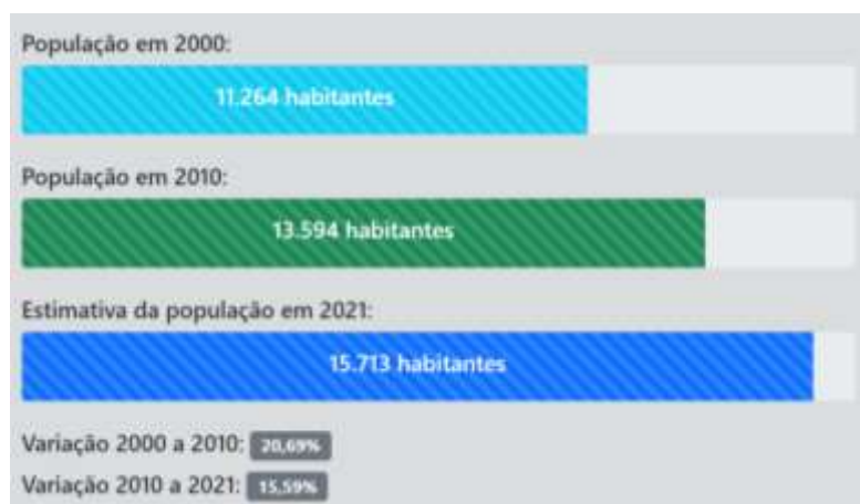
Gráfico 1 - Taxa de crescimento populacional estimada.